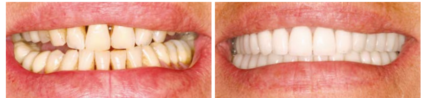
Patient avant / après