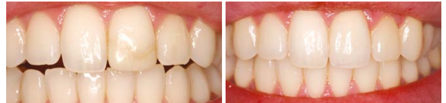
Patient avant / après