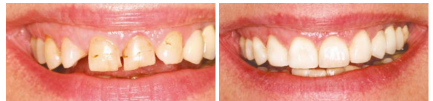
Patient avant / après